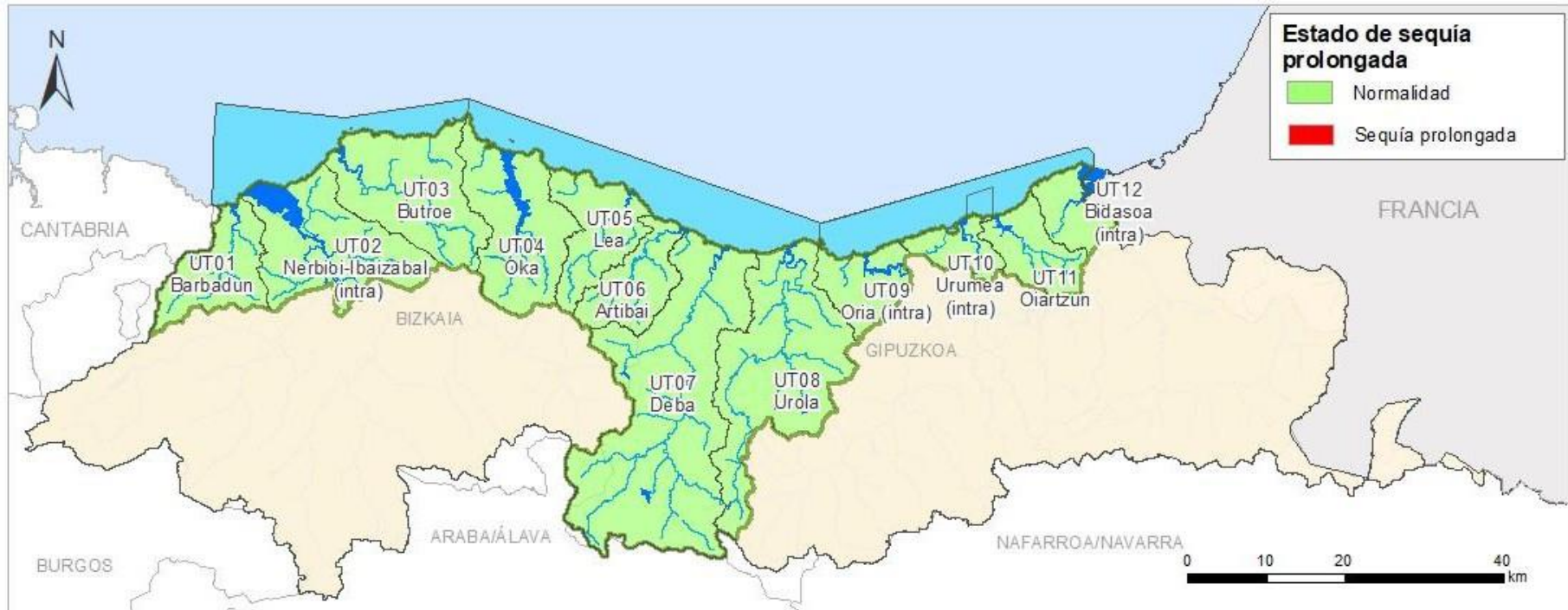
ÍNDICE DE ESTADO INTEGRADO DE SEQUÍA PROLONGADA