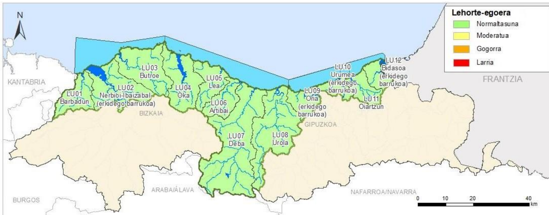
LEHORTE EGOERAREN ADIERAZLEA