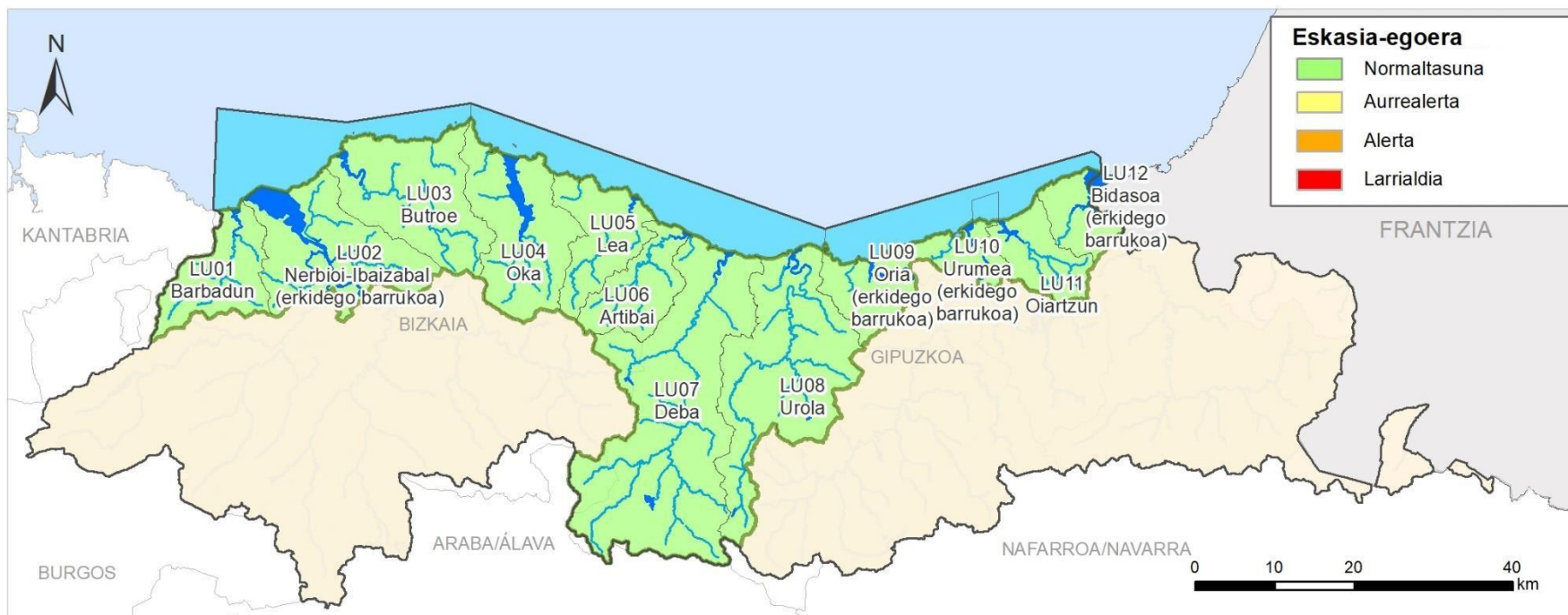
ESKASIA EGOERAREN ADIERAZLEA