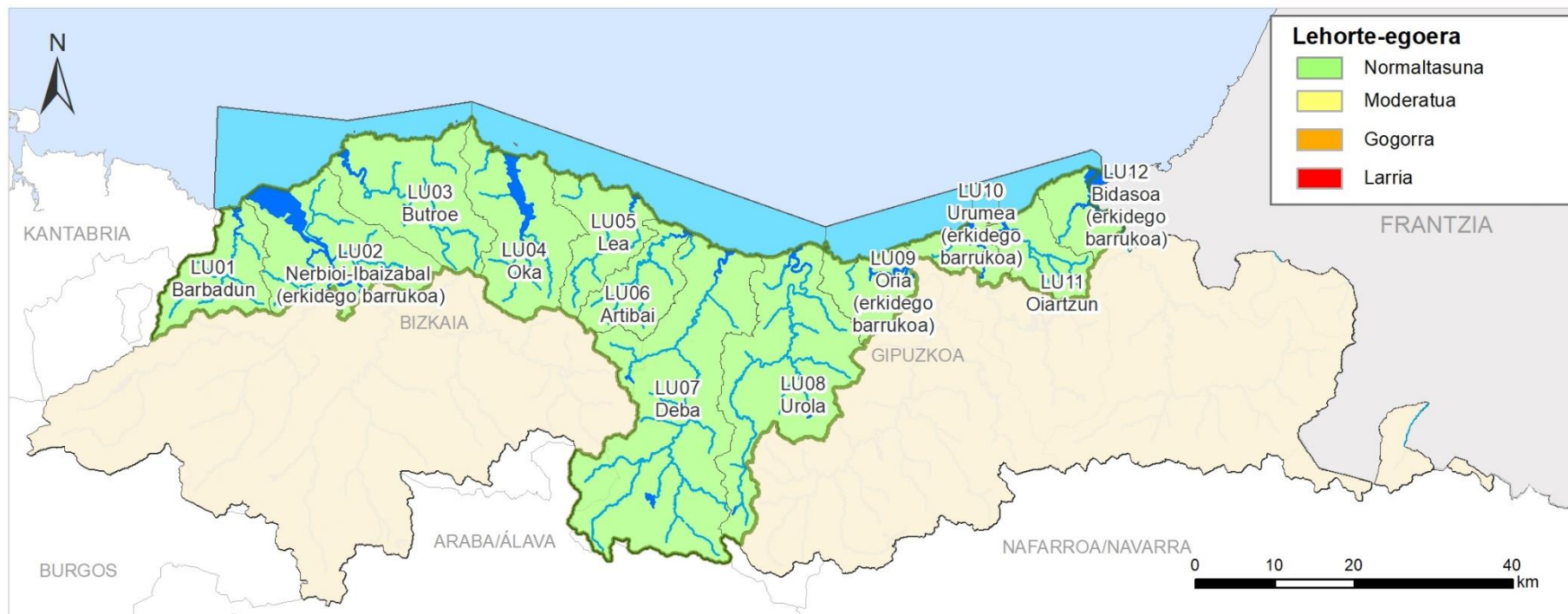
LEHORTE EGOERAREN ADIERAZLEA